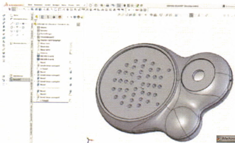
Die Gehäusereihe „Blob“ fördert Anwendungen, die einer Vielzahl von Menschen mit unterschiedlichen Handgrößen gerecht werden. Hier ein Beispielgehäuse, dargestellt in Solidworks.