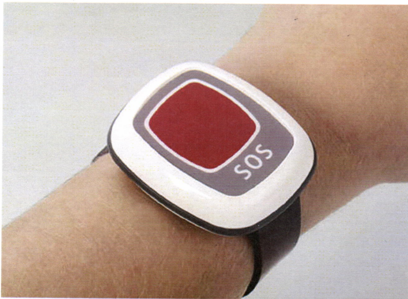
Ein Gehäuse als Beispiel für sehr viele: OKW Gehäusesysteme liefert mittlerweile auch Gehäuse, die am Arm getragen werden können, wie hier für ein Notrufsystem.

trag sind dabei klein. „Wir haben eine durchschnittliche Losgröße von 100“, so Fertigungsleiter Helmut Böhrer. Für alle muss eine konstruktive Anpassung gemacht werden und im Anschluss ein NC-Programm. Ohne CAD/CAM geht das nicht mehr.