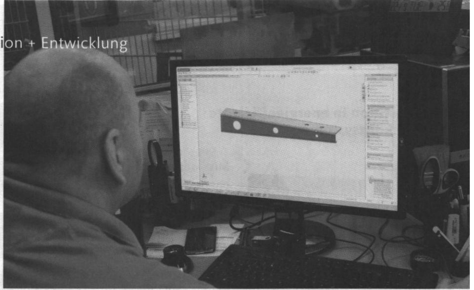
Topworks-Arbeitsplatz mit Blechwinkel in der Bearbeitung.

Die Software Topworks verbindet Solidworks mit den Programmiersystemen der Trutops-Reihe von Trumpf und stellt so die Durchgängigkeit der Prozesskette „Blech“ von der Konstruktion bis zur Fertigung sicher. Das Unternehmen Fryka-Kältetechnik aus Esslingen hat die Software vor wenigen Jahren eingeführt, um die Qualität entlang der Prozesskette Blech zu erhöhen.